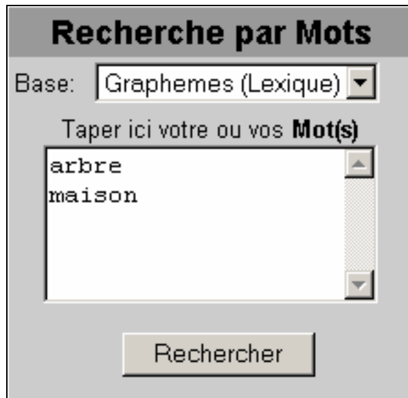
Figure 3 Exemple de requête de type "Recherche par Mots"

Le deuxième moteur de recherche permet d'effectuer des recherches par propriétés sur Lexique et d'autres bases simultanément.